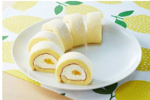
上段左から:「広島うまいもん弁当」(税込 659 円)、「六穀豚ともち麦入広島菜ご飯のおにぎりセット」(税込 387 円) 下段左から:「広島菜漬の麺特盛明太マヨパスタ」(税込 559 円)、「レモンのもち食感ロール(瀬戸内産レモン)」(税込 397 円)

今回発売するのは、広島県産瀬戸内六穀豚の生姜焼きや呉風肉じゃがなどの広島の“うまいもん”をつめた「 広島うまいもん弁当 」(税込 659 円)、広島県産もち麦『キラリモチ』入り広島菜ご飯のおにぎりとおかずをセットにした「 六穀豚ともち麦入広島菜ご飯のおにぎりセット 」(税込 387 円)、明太マヨパスタに広島菜漬を添えた「 広島菜漬の麺特盛明太マヨパスタ 」(税込 559 円)、瀬戸内産レモンピールを使用した「 レモンのもち食感ロール(瀬戸内産レモン) 」(税込 397 円)の4品です。